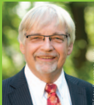
Rolf-Georg Köhler Oberbürgermeister Stadt Göttingen

Eine Kampagne des Klima-Bündnis Europäische Kommunen in Partnerschaft mit indigenen Völkern – für lokale Antworten auf den Klimawandel. klimabuendnis.org